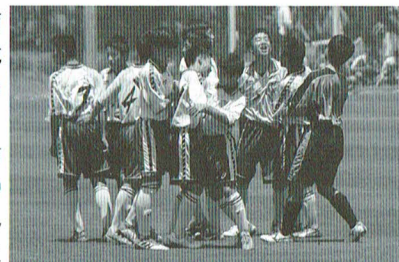
●中学生 関西大会・淡路島佐野運動公園2018.6.2

して地域のスポーツ環境づくりを促進することは、地域のジュニア年代のスポーツ活動を豊かにするとともに、地域社会での人のつながりを深めるものであると信じています。